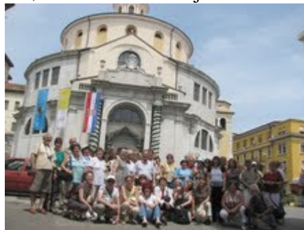
Az MKSZ csoportja a fiumei Szent Vitus katedrális előtt

2010. június 9-13. között zajlott le az MKSZ tanulmányútja. Az út során történelmünk nagy alakjai, a Zrínyi és Frangepán családok ősi várait, Csáktornyát, Zágrábot és Károlyvárost érintve Fiumét, a mai Rijekát tekintették meg a résztvevők. A programban Fiume megtekintésén felül szerepelt egy szép és hangulatos kirándulás, amely során csoportunk megcsodálhatta Abbázia, Lovran, Crkvenica és Senj városát.